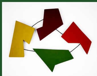
Raúl Lozza, Relief (1945) Colección Patricia Phelps de Cisneros