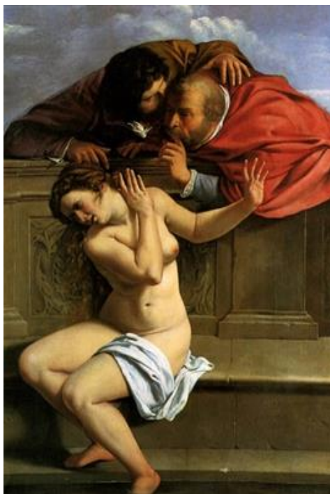
Susana y los viejos de Artemisia Gentileschi, 1656, Schloss Weißenstein, Pommersfelden, Alemania.

En las últimas décadas los estudios de género han ido ganando peso en el ámbito académico y constituyen, en la actualidad, uno de los campos que despierta un mayor interés, tanto por los temas tratados, que han abierto nuevas formas de interpretación y reflexión sobre la realidad histórica, como por la diversidad de campos desde los que se puede producir su análisis, generando, de este modo, múltiples puntos de vista.