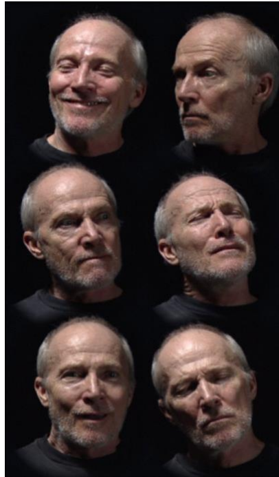
Six Heads (Serie The Passions ) de Bill Viola, 2000, 20'. Videocreación.

Así pues, el objetivo de esta mesa versará sobre todas las posibles vinculaciones entre la cultura audiovisual y el estudio historiográfico de las emociones. También sobre los cambios o mutaciones producidos en la representación de estas a lo largo del tiempo y en función del medio seleccionado, siendo el audiovisual fiel reflejo de determinados sentimientos como espejo de la sociedad actual. Se tratará de recoger en ella estudios que intenten dar respuesta a cuestiones en las que el cine, el videoarte, el videoclip, la videodanza, videojuego, el consumo audiovisual en redes sociales o internet, el vídeo doméstico, el documental y una infinidad de propuestas de carácter audiovisual más, sirvan de ejemplo o se sitúen como paradigma de lo emocional, del análisis de los afectos y de las posibles vertientes que de ello puedan derivar.