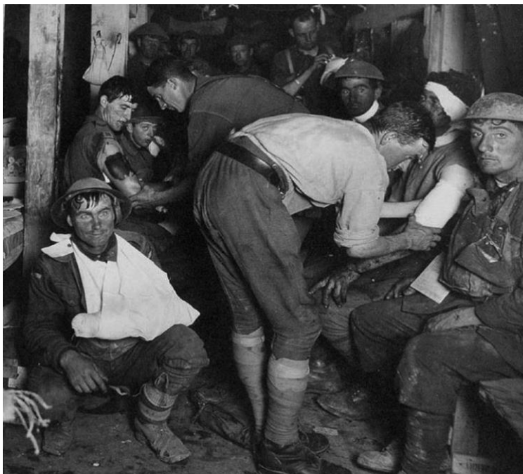
Soldados durante la Primera Guerra Mundial cerca de Ypres (Bélgica) en 1917.

Desde el último tercio del siglo XIX, el concepto de trauma se ha ido ampliando más allá de su origen médico-quirúrgico debido a la implicación y el interés de múltiples disciplinas. Inicialmente tuvo una estrecha relación con los conflictos bélicos y la huella que estos dejaban sobre los que participaban en ellos, el llamado shock de trincheras. A partir de esta idea y con las dos guerras mundiales de por medio, el estudio de la neurosis de guerra adquiere una dimensión, una de carácter más colectivo e identitario. Durante las últimas décadas del siglo XX se comienza a indagar sobre el “síndrome del superviviente” y cómo podría afectar a generaciones posteriores. En este sentido, cobra especial relevancia el término acuñado por Marianne Hirsch de “post-memoria” que se refiere a la vinculación que tiene la “generación posterior” con el trauma cultural, colectivo o individual vivido por sus predecesores.