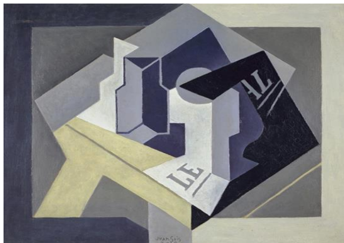
Frutero y periódico de Juan Gris, 1920, Real Academia de Bellas Artes de San Fernando, Madrid.

Por otro lado, su carácter persuasivo está también estrechamente ligado a la exaltación de las emociones de sus consumidores, como revela su utilización para la difusión de ideas políticas o propaganda comercial, poner el objetivo sobre determinados temas de actualidad o explotar el morbo informativo para obtener una mayor audiencia. Estas cuestiones, unidas a la proliferación de fake news , son algunas de las problemáticas a las que se enfrenta la ciudadanía en la defensa de su derecho a la información.