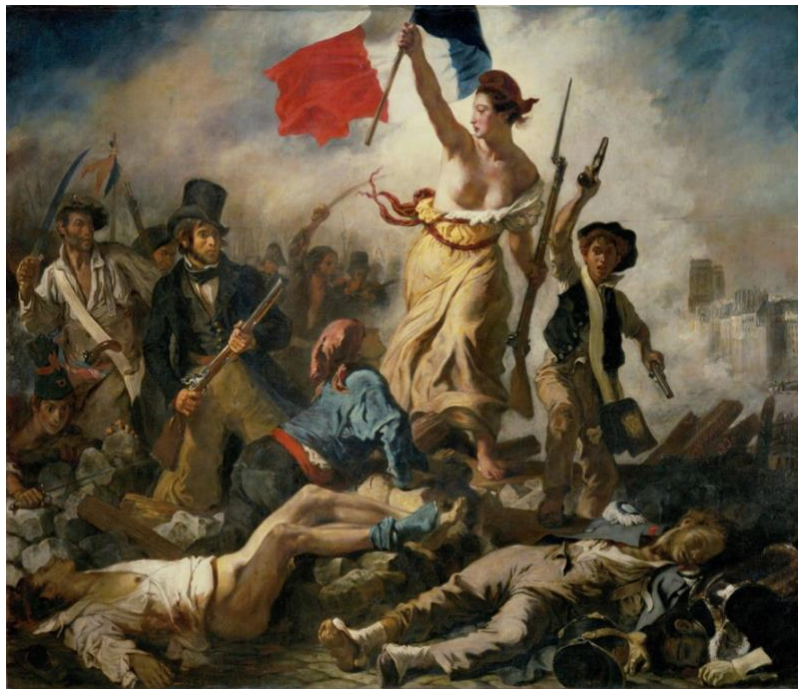
La Libertad guiando al pueblo de Eugène Delacroix, 1830, Museo del Louvre, París

En definitiva, las propuestas deberán plasmar cómo nuestra identidad es un relato en constante evolución, que se teje a través de las emociones y las experiencias, queda materializado en la rica historia que nos ha precedido y cuyos sentimientos influyen en cómo las personas se identifican y perciben su entorno, reflejándose en diversas disciplinas como sucede en el arte, la literatura o la música. A modo de ejemplo, este reflejo lo podríamos hallar en obras como Las dos Fridas de Frida Kahlo, el poema Pido la paz y la palabra de Blas de Otero o a través del género musical conocido como música popular, el cual acaba siendo el testimonio de una identidad colectiva, reflejando sus emociones más profundas y siendo un puente que conecta a las personas y rompe con barreras culturales y lingüísticas.