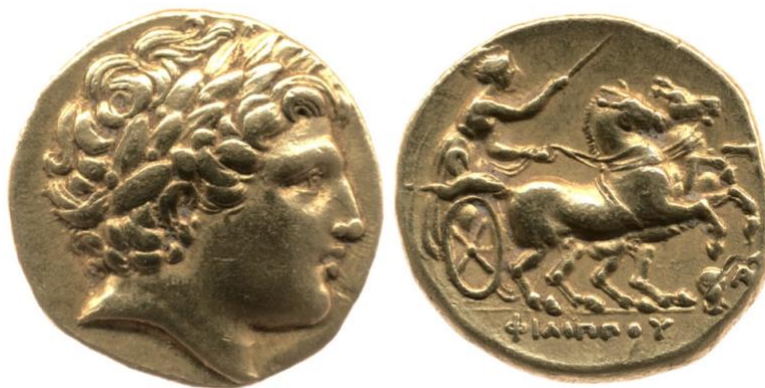
Estatero con cabeza de Apolo laureado y carro tirado por dos caballos, c. 323-316, British Museum, Londres

En definitiva, esta mesa recogerá aquellas propuestas que realicen una revisión histórica de la cuestión emocional en los diferentes sistemas filosóficos desarrollados desde la Antigüedad hasta la Contemporaneidad.